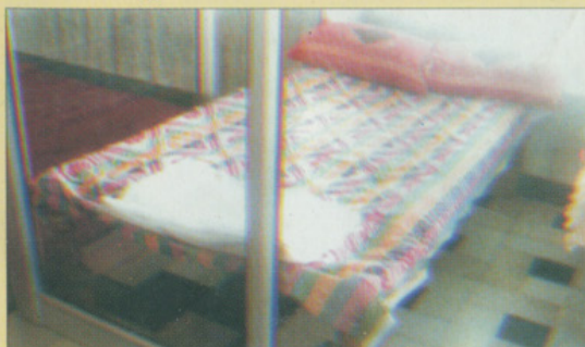
ਲਕੜੀ ਦਾ ਮੰਜਾ