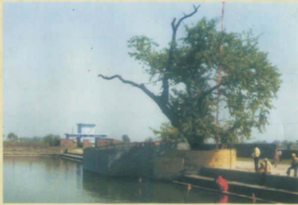
ਗੁ: ਸਰੋਵਰ ਕਿਸ਼ਨ ਕੰਵਰ ਜੀ ਤਲਾਬ

ਪਰਿਵਾਰ ਸਮੇਤ ਉਥੇ ਜਾ ਕੇ ਰਹਿਣ ਲੱਗ ਪਏ। ਉਸ ਸਮੇਂ ਬੂੜਾ ਜੀ ਦੀ ਉਮਰ ਪੰਜ ਕੁ ਸਾਲ ਦੀ ਸੀ। ਆਪ ਜਦੋਂ ਥੋੜੇ ਜਿਹੇ ਵੱਡੇ ਹੋਏ ਤਾਂ ਆਪਣੇ ਸਿਆਣੇ