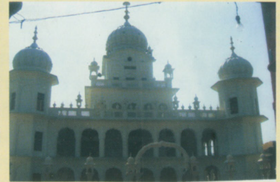
ਗੁ: ਤਪ ਅਸਥਾਨ ਬਾਬਾ ਬੁੱਢਾ ਜੀ

ਹੋ? ਆਪਣੇ ਮਾਤਾ ਪਿਤਾ ਦੇ ਨਾਂ ਅਤੇ ਬਹੁ-ਪਤਾ ਵੀ ਦੱਸੋ? ਜਦੋਂ ਗੁਰੂ ਜੀ ਨੇ ਇਹ ਸਵਾਲ ਕੀਤਾ ਤਾਂ ਸਾਰੇ ਬਾਲਕ ਇਕ ਦੂਜੇ ਵੱਲ ਵੇਖਣ ਲੱਗ ਪਏ। ਕੋਈ ਵੀ ਨਾ ਬੋਲਿਆ।