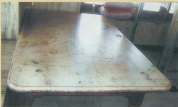
ਸੰਗਮਰਮਰ ਦੀ ਸਿੱਲ

ਸਤਿਗੁਰਾਂ ਦੇ ਦਰਸ਼ਨ ਕੀਤੇ ਤੇ ਨਿਹਾਲ ਹੋ ਗਏ। ਆਏ ਬਾਲਕਾਂ ਨੂੰ ਪਾਤਸ਼ਾਹ ਨੇ ਪੁੱਛਿਆ - ਤੁਸੀਂ ਕਿਸ ਦੇ ਬਾਲਕ